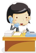
熊本県経営者協会