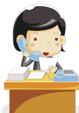
熊本県経営者協会